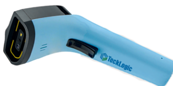
Escáner tipo pistola