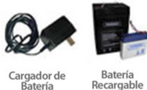
Cargador de Bateria